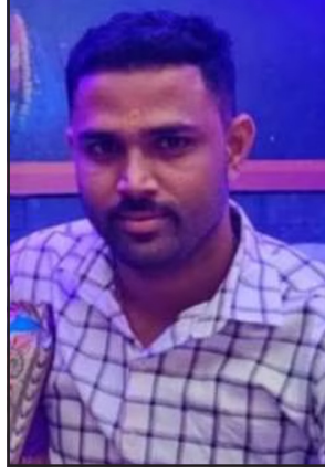
असल्याचे या चित्रफितीत त्याने सांगितले होते. परंतु विरार पोलिसांनी